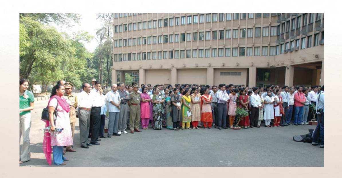
A section of the gathering of the staff at Trombay on the Founder's Day

mines at Turamdih and Banduhurang and starting of a new uranium processing mill at Turamdih. With the deliveries of uranium from Turamdih the situation will start easing out. Construction of a new mine and mill at Tummalapalli in Andhra Pradesh has been approved by the Government and is about to start. We also hope to be able to take up Uranium projects in Meghalaya and Karnataka to be followed up by projects in Rajasthan and other places. Most of these deposits have been known for a long time. The present fuel demand supply mismatch would not have arisen, had these projects been pursued in the same spirit with which Dr. Bhabha started activities at Jaduguda. We are determined to move ahead with the growth of our PHWR programme and realize the planned 10,000 MWe of PHWR capacity in the shortest possible time. I would like to compliment our colleagues in NPCIL for their professional approach to programme management. They have excelled in all domains of their activities specially the innovative fuel management strategies to maximize fuel use efficiency, large scale rehabilitation activities and efficient construction and operations management. All other units